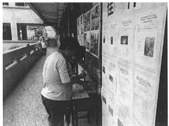
活動說明：海洋詩競賽