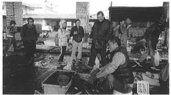
活動說明：魚市場實地參訪