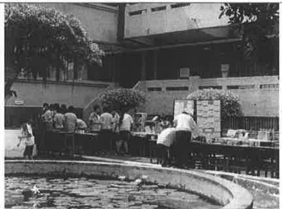
活動說明：海洋書展