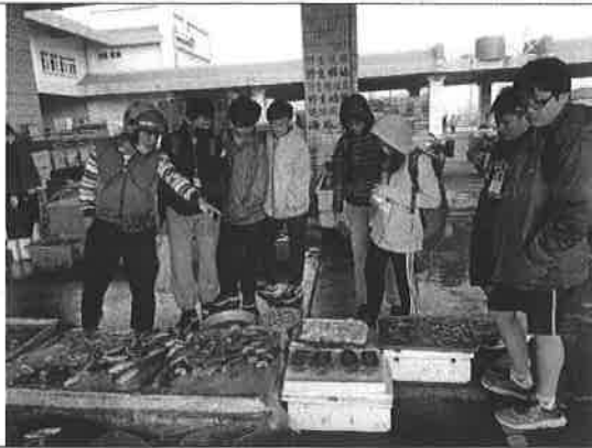
活動說明：魚市場實地參訪