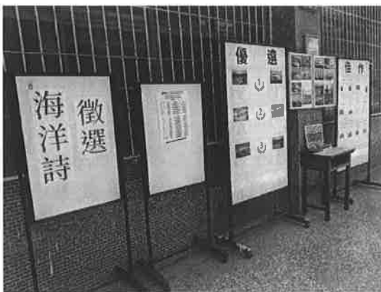
活動說明：海洋詩競賽