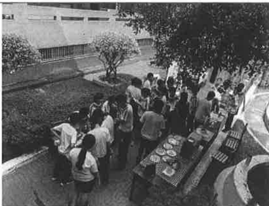
活動說明：海洋書展