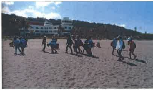
活動說明：淨灘活動