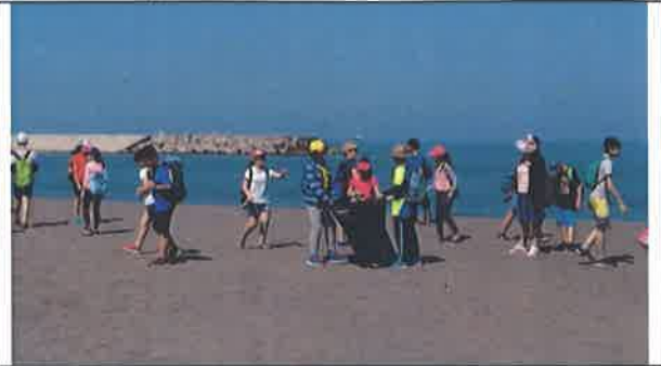
活動說明：淨灘活動