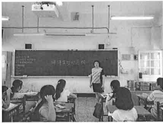
活動說明：討論海洋生物的危機