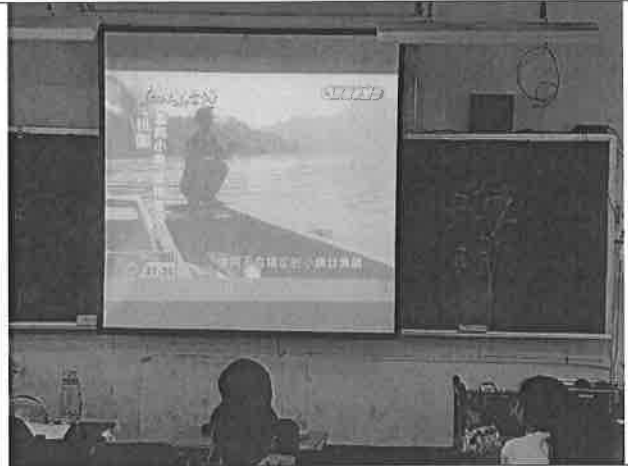
活動說明：不肖漁民濫捕小魚危及生態