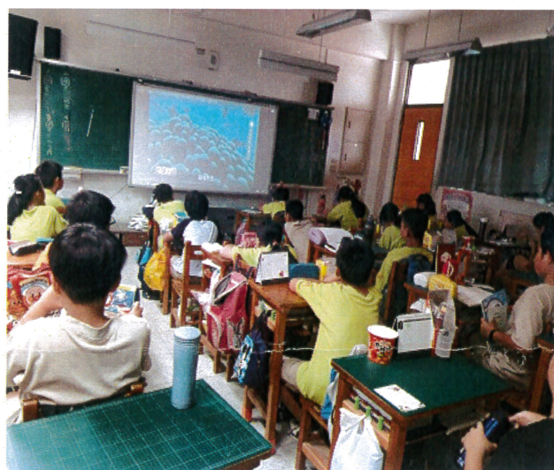
活動說明：觀賞科普海洋影片