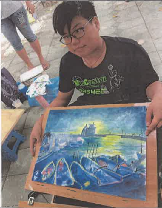
活動說明：學生寫生作品1