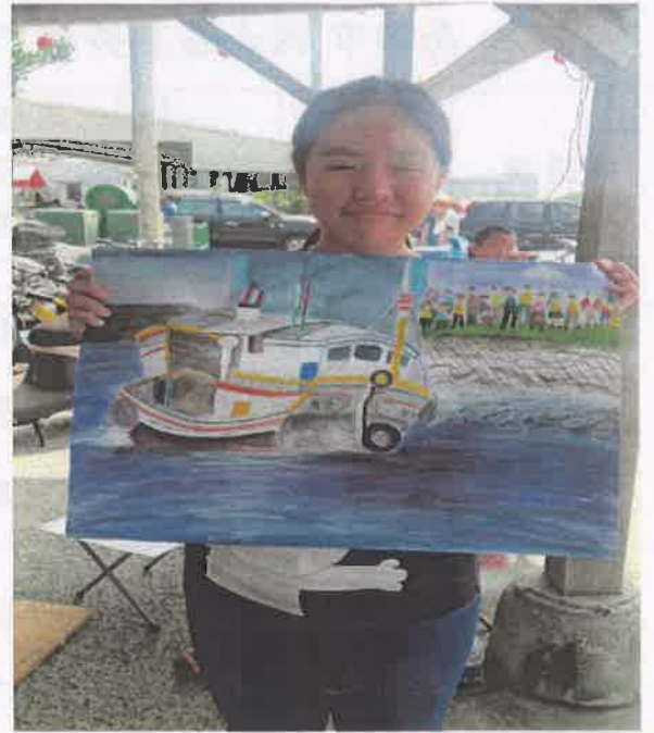
活動說明：學生寫生作品2