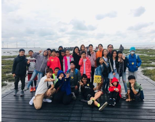
活動說明：校外教學-高美濕地