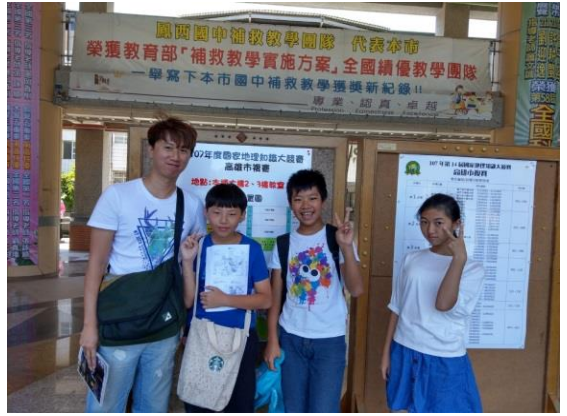
活動說明：參與國家地理競賽